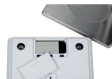
Druckpunktstasten mit akustischem Signal