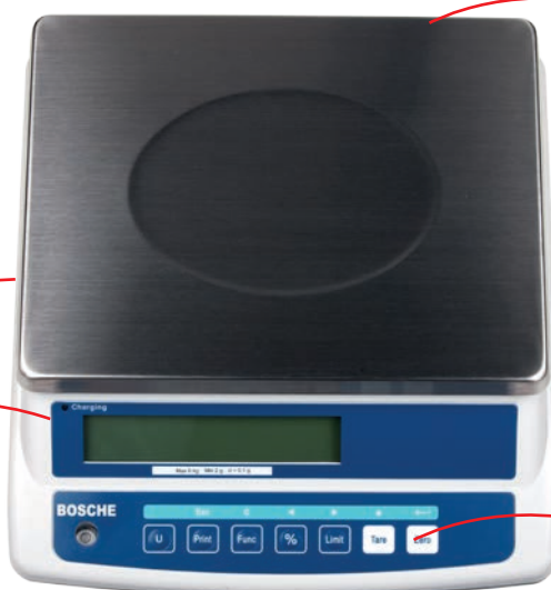
Display und Folientastatur staubdicht